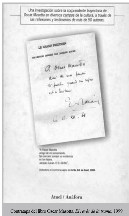
Contratapa del libro Oscar Masotta. El revés de la trama , 1999

Jacques Lacan: El anclaje de su enseñanza en la Argentina , Catálogos, 2009. (De la introducción pp.13-14)